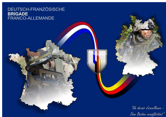
Devise : „Un devoir d'excellence – Dem Besten verpflichtet“