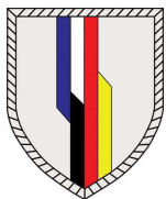
Ecusson de la brigade franco-allemande