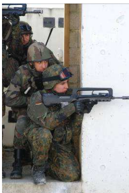
Militaires français et allemands s'entraînent conjointement au combat en zone urbaine.