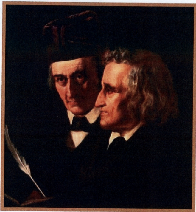
Doppelporträt der Brüder Jacob und Wilhelm Grimm, Elisabeth Jerichau-Baumann. 1855

Elèves du collège Pierre de Ronsard de Bourgueil, Indre et Loire.